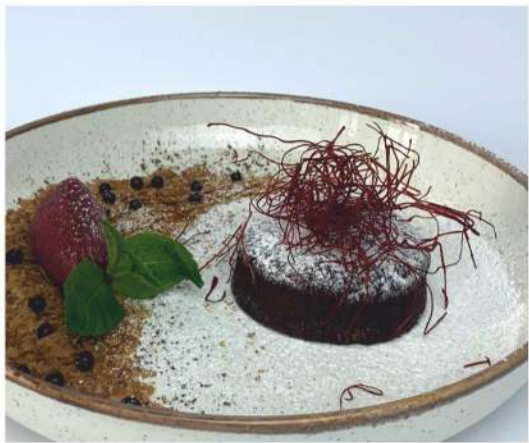
Фондан с перцем чили и ягодным сорбетом