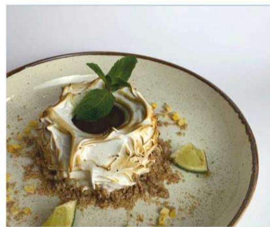
Муссовый десерт с манго, маракуйей и семенами Чиа