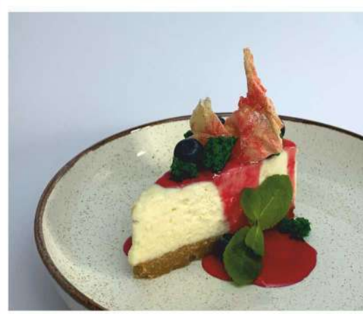
Классический Чизкейк с малиновой карамелью