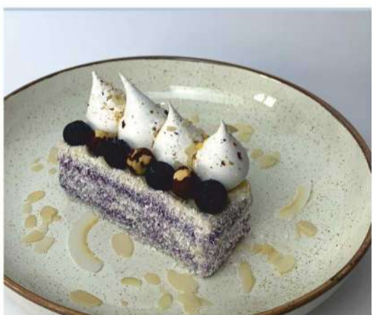
Лавандовый сметанник с орехом пекан и свежими ягодами